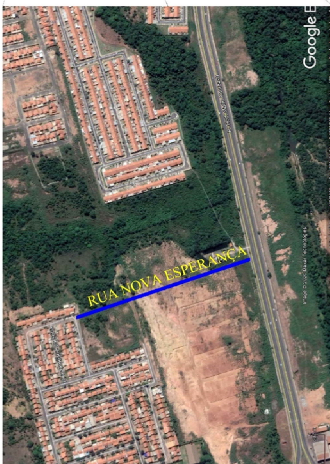
Bairro: Nova Esperança - Várzea Grande - MT